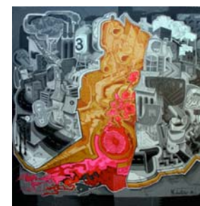
Eduardo Dantas IN-SIDE, 2008