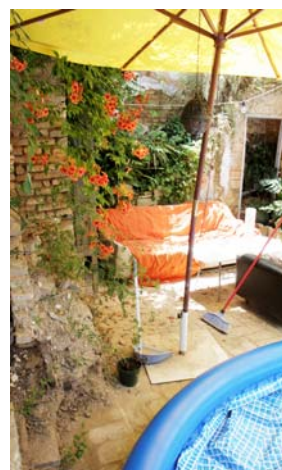
Celia Macías La sombrilla en el patio, 2008